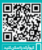
کوارکد راسکن کنید

وقتی شئل قرمزی به خانه مادر بزرگ رسید، متوجه شد قیافه مادر بزرگش تغییر کرده، پرسید: «مادر بزرگ چه صدای کلفتی داری! چه چشم‌های بزرگی داری! چه گوش‌ها و دست‌های بزرگی داری! چه دندان‌های بزرگی داری؟!»...