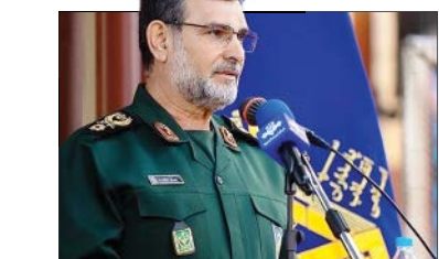
فرمانده نیروی دریایی سپاه در جمع خبرنگاران

سخنان پرویز ثابتی در مستند پخش شده از شبکه من و تو تناقض بسیار زیادی با روایت‌های نقل شده از وی در قالب تاریخ شفاهی دارد. نفر دوم ساواک در دوران پهلوی که ژست منتقد‌شاه را برداشته در کتاب «دامگه حادته» نه تنها اقدامات پلیس امنیتی را که خود از