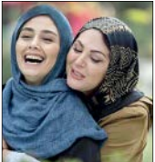
سحر و سحر