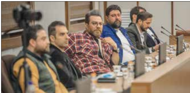
دیدار وزیر ارشد با هنرمندان موسیقی پاپ

احسان آقایی در ابتدای این نشست با اشاره به این‌که نمایشگاه آینه در آینه با حمایت جشنواره هنرهای تجسمی فجر برگزار می‌شود، تصریح کرد: این جشنواره به دوره‌ای از هنر معاصر ایران می‌پردازد که از جریان هنر اعتراضی آغاز می‌شود و در نهایت به هنر انقلاب و بعد هنر جنگ پیوند می‌خورد. همه ما می‌دانیم جریان هنر اعتراضی در دوره معاصر تاریخ کشورمان تقریباً از انقلاب مشروطه آغاز می‌شود و در برهه‌هایی مثل کودتای ۲۸ مرداد ۱۳۳۲ و بعدها حتی در گوشه‌هایی از جریان هنر سقاخانه‌ای این جریان اعتراضی قابل خوانش است. طی دهه‌های اخیر بارها در مورد هنر اعتراضی و انقلابی ایران نمایشگاهی برگزار شده که همگی معمولاً از دو گرایش غالب برخوردار هستند. نمایشگاه‌هایی که در داخل ایران برگزار شده به وجه معنایی آثار بیشتر پرداخته و نمایشگاه‌هایی که در خارج برگزار شده با نگاهی