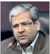
۵۱ درصد مجرمانی که در چند ماه گذشته دستگیر شده‌اند جرم‌اولی هستند

از نقش دستگاه‌های حمایتی در توانمندی خانواده‌ها و پیشگیری از جرم که بگذریم باید گفت نهادهای دیگری مانند پلیس و قوه قضاییه نیز آن‌طور که باید با یکدیگر هماهنگ نیستند. چند سال پیش که به عنوان خبرنگار حوادث پله دادسراها را پالین می‌کردم از این متعجب می‌شدم که مجرمان به‌خوبی با یکدیگر ارتباط دارند و راهکار پیش پای هم می‌گذارند، مثلا دو سارق به هم می‌گفتند در فلان منطقه درزی نکن چراکه رئیس کلانتری باهوشی دارد. اما در مقابل در برخی دادسرها در یک شعبه مجرمی محاکمه می‌شد که در شعبه کناری‌اش قاضی به دلیل جرم دیگری به دنبال محل اختفایش می‌گشت! 🔪