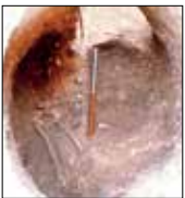
محوطه تاریخی طاق بستان در دامنه کوهی به همین نام در شمال‌شرقی شهر کرمانشاه واقع شده‌است. نمایی از سنگ‌نگاره اردشیر دوم و دو ایوان سنگی به نام‌های ایوان کوچک و بزرگ از دوران ساسانی در همین محوطه قرار دارند

اکنون تنها نیم‌میلیون هکتار از تالاب هورالعظیم باقی مانده که این مساله خود مقدمه فروپاشی، مقدمه تشدید کانون‌های بحرانی فرسایش بادی و افزایش ریزگردهایی است که سلامت انسان را به‌طور جدی تهدید می‌کنند. با این همه از آنجاکه تالاب هورالعظیم در پیاب رودخانه کرخه که دومین رودخانه پرآب کشور است قرار دارد، اگر سالانه از سمت ایران تقریباً دومیلیارد مترمکعب حقابه دریافت کند تاب‌آوری خود را حفظ می‌نماید.