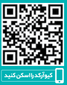
کینواک را سکن کنید