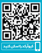
کیوارتد را اسکن کنید