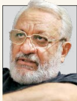
احمد میراحسان نویسنده و منتقد