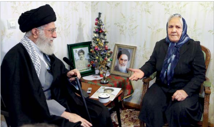
حضور رهبر انقلاب در خانه شهید و پرت آزار

رهبر انقلاب در عادت پسندیده و همیشگی دیدار با خانواده‌های شهدا از حضور در خانه شهدای اقلیت‌های دینی هم غافل نیستند و اتفاقاً این بخش از حضورها و دیدارها در سال‌های مختلف، حلاوت خاصی هم دارد و به حضورهایی پر حس و حال و ویژه تبدیل می‌شود. گاهی این دیدارها در شب کریسمس اتفاق افتاده و شیرینی مواجهه با رهبر انقلاب را برای خانواده‌های شهدای مسیحی بیشتر کرده است. به عنوان مثال حضور رهبر معظم انقلاب در خانه شهید روبرت لازار از این نوع بود؛ مادر این شهید آشوری در این دیدار خجالت‌زده به رهبر گفت: «خانم کوچک است...» که آقائی گذارند شرمندگی مادر ادامه پیدا کند: «دل باید بزرگ باشد. وقتی انسان هدف داشته باشد، هرجا باشد خوب است.»