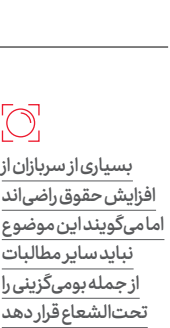
بسیاری از سربازان از افزایش حقوق راضی‌اند اما می‌گویند این موضوع نباید سایر مطالبات از جمله بومی‌گزینی را تحت‌الشعاع قرار دهد