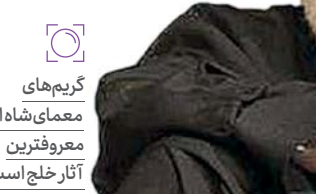
گرم‌های معمای‌شاه از معروفترین آثار خلج است

برای استفاده مناسب از آرشپو باید برنامه‌ریزی داشت. تلویزیون آرشپوی غنی و پراز محصولات خاطره‌انگیز دارد که می‌توان با برنامه‌ریزی درست و تقسیم‌بندی آنها میان شبکه‌های مختلف، شرایط بازپخش‌شان را فراهم کرد. مستند، داستانی، مسابقه، برنامه ترکیبی گفت‌وگو محور و... در آرشپو موجود است و حالا با یک پالایش و ارتقای کیفیت تصویری، می‌توان شرایط استفاده بهتر از آنها را فراهم کرد تا مخاطبان نوجوان و جوان که پیشتر این محتواها را ندیده‌اند بتوانند آنها را ببینند و از آن طرف استاندارد‌های تصویری تلویزیون در دوره‌های مختلف هم معلوم شود. ❏