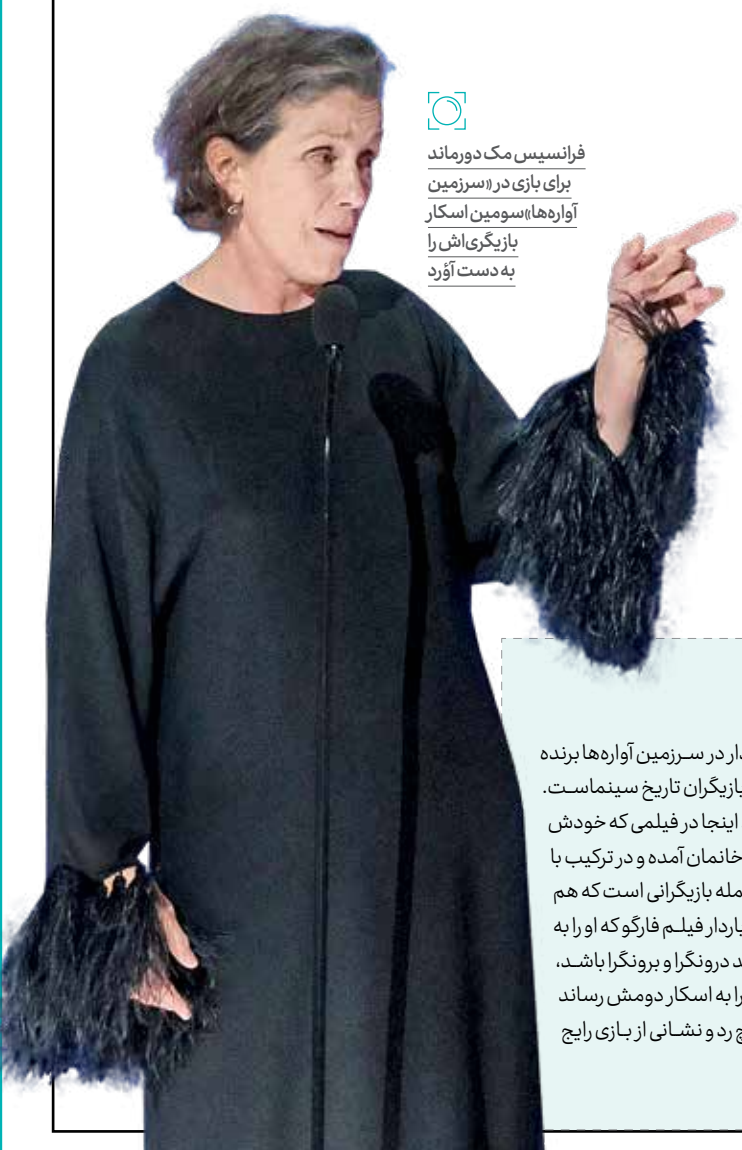
فرانسیس مک دورماند برای بازی در «سرزمین آواره‌ها» سومین اسکار بازیگری‌اش را به دست آورد

هفدهمین شماره دوماهنامه ادبی «چامه» منتشر شد