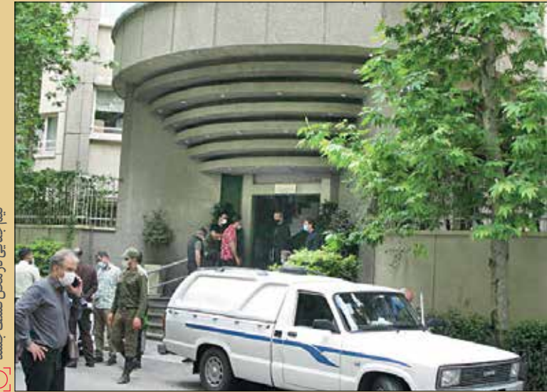
تیم جنایی در محل کشف جسد

وی افزود: آثار درگیری و به‌هم‌ریختگی در خانه‌اش پیدا نشده است. قرص‌هایی در خانه پیدا شده