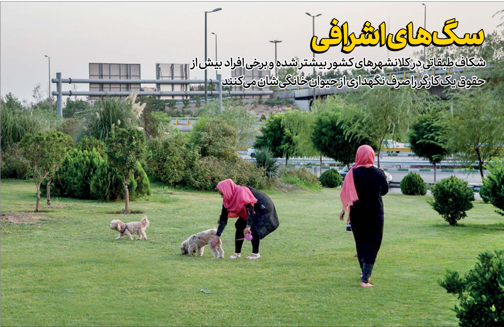
بیشتر فضاهای سبز شهری این روزها به محل برای سگ‌پروری تبدیل شده‌است

شکاف طبقاتی در کلانشهرهای کشور بیشتر شده و برخی افراد بیش از حقوق یک کارگر را صرف نگهداری از حیوان خانگی‌شان می‌کنند