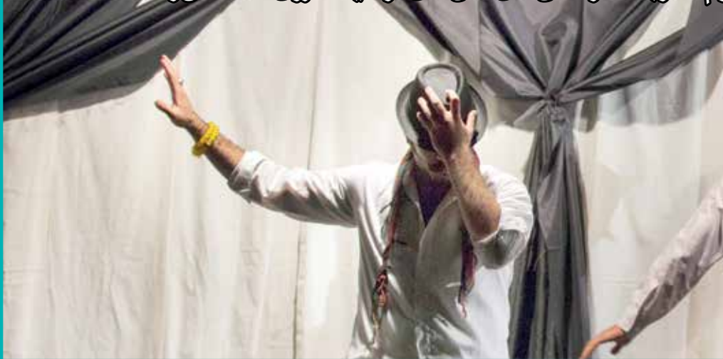
عکس ژانینی است

ناح تماشاخانه‌های متعدد خصوصی و کتار رفتن نقش دولت در رونق آنها های مرسوم تئاتر بلکه در سالن‌های هتل‌های گر انقیصت روی صحنه می‌رفتند