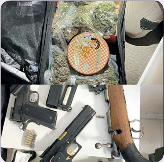
کشتیبات قضایی بانک

🔪 پلیس کوئینزلند استرالیا پس از انجام تحقیقات طولانی، موفق شد یک تیم قاچاق موادمخدر را شناسایی کند. در منطقه لوگان، پلیس ۱۳ نفر را به علت جرایم مرتبط با موادمخدر و حمل سلاح گرم متهم کرده است. این ۱۳ نفر روز جمعه در بازرسی از املاک لوگان، بریزبن، خلیج رلند، ایپسویچ و ساحل سان‌شاین دستگیر شدند. این بازداشت‌ها بخشی از تحقیقات گسترده‌ای است که البته به گفته پلیس کوئینزلند، همچنان ادامه دارد. طی این عملیات با نام تانگو کلاود کارآگاهانی از گروه‌های مختلف مانند باند سازمان یافته جنایت، جوخه اصلی جرایم سازمان‌یافته و بزرگ منطقه جنوب شرقی، ساحل سان‌شاین، افسران مناطق لوگان و بریزبن جنوبی و همچنین افسران جوخه بریزبن داگ و خدمات اصلاحی کوئینزلند حضور و در کشف و دستگیری اغضای یک باند مخوف موادمخدر با یکدیگر همکاری بسیار گسترده‌ای داشتند. دستگیری اعضای این باند پس از صدور و اجرای حکم جست‌وجوی املاک در سراسر لوگان، بریزبن، خلیج رلند، ایپسویچ و ساحل سان‌شاین در روز ۱۸ ژوئن (۲۸ خرداد) انجام گرفت. طی جست‌وجوهای نیروهای پلیس، مقادیر زیادی متیل آمفتامین، شاه‌دانه، پوپرنورفین، پول نقد و شش قبضه سلاح گرم کشف و ضبط شد. اعضای این گروه تاکنون به ارتکاب بیش از ۴۰ جرم متهم شده‌اند.