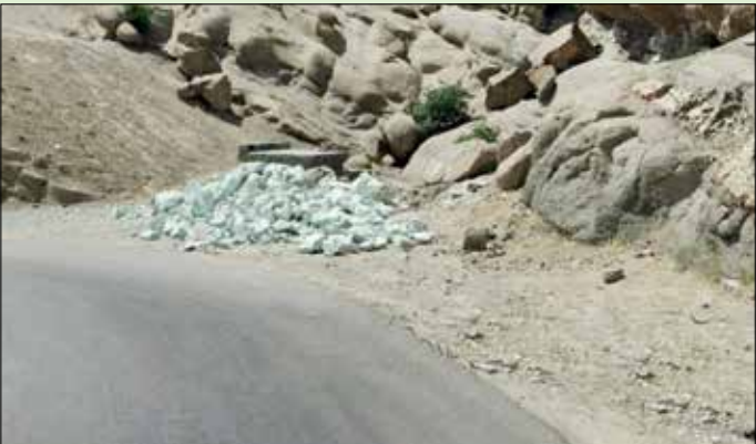
این سنگ‌ها احتمال ساخت وساز در اطراف این دور ا می‌دهد

نکته نگران‌کننده این‌که کوه‌های وردیج ظاهرا به حال خود رها شده‌اند، همچون بافت تاریخی روستا که آماج ساخت و ساز قرار گرفته است. سال ۹۸ محسن شیخ‌الاسلامی، معاون میراث فرهنگی وقت استان تهران قول ثبت ملی کوه‌های زیبا و عجیب این روستا را به عنوان اثر طبیعی ملی داد امری که تاکنون محقق نشده است. حال باید پرسید اکنون مسؤول این کوه‌ها میراث فرهنگی است که از سال ۹۸ قول ثبت طبیعی این اثر را داده یا بخش گردشگری استان تهران ( به دلیل تعداد زیاد گردشگر و بازدیدکننده) یا دهیاری، فرمانداری، راهداری و حتی منابع طبیعی و شاید همه با هم، چراکه هیچ بخشی در این میان پاسخگو نیست. اکنون دست کم ۰ ابرج وسط بافت روستا دیده می‌شود و این پرسش را پیش آورده مگر این روستا طرح هادی ندارد؟ با چنین برج‌هایی خودرو چگونه در کوچه‌های تنگ و باریک عبور خواهد کرد؟ فاضلاب این حجم از ساخت و ساز و جمعیت آن کجا دفن می‌شود و آب آشامیدنی در دراز مدت چگونه تامین خواهد شد؟ در غرب تهران از بزرگراه خرازی که راه خروجی جاده وردیج- واریش است باید فقط هشت کیلومتر رانندگی کرد تا به وردیج و این ارواح سنگی رسید که روبه‌روی آنها روستا و باغ‌های متعدد با چشم‌اندازی دلنواز دیده می‌شود. در پیچ پایین‌تر این کوه‌ها بساط قلیان سرا دیده می‌شود و هیچ ضرورتی به احداث سازه جدید آن هم درست جلوی کوه‌ها نیست. از سویی گردشگران زیادی از این مجموعه طبیعی و روستا بازدید می‌کنند و به نظر می‌رسد هنوز هیچ طرح گردشگری و سرویس‌دهی خاصی برای گردشگران وجود ندارد، درحالی که این روستا قابلیت تبدیل شدن به روستای نمونه گردشگری و ایجاد بومگردی و تولید محصولات بومی را با توجه به حجم گردشگران دارد. ]