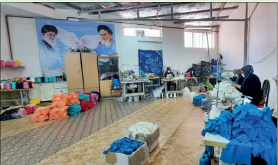
برپایی کارگاه‌هایی مانند خیاطی و قالیبافی در مسجد امام حسین(ع) واحدی اشتغال اهالی محل را برطرف کرده است

دلیل مهیا نبودن شرایط تحصیل، دست‌ازدین‌خواندن و ادامه تحصیل کشیده بودند.» آسیبی که باعث شد فعالان مسجد به تکاپو برای شناسایی این کودکان و نوجوانان بیفتند، «بررسی چرایی کارکردن برخی از این کودکان و حل آن معضل مشخص برای برخی از این کودکان و تهیه ابزار و وسایل تحصیل برای دیگر کودکانی که از تحصیل جا مانده بودند از جمله اقداماتی بود که انجام دادیم.» اقداماتی که البته نتایج پدی هم نداشته و خیلی زود می‌شود تشخیص داد که تعداد کودکان کار در منطقه کم شده است.