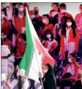
رضایی یا قهرمانی در المپیک توکیو برای چهارمین بار توانست در کسوت مربی والیبال نشسته به مدال طلا برسد