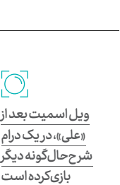
ویل اسمیت بعد از