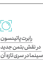
در نقش بتمن جدید