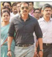
فیلم تازه جین کمپین ۲ جایزه اصلی گلدن گلوب امسال را از آن خود کرد

دومین قسمت درام اجتماعی و پرتنش «هجوم» ساخته می‌شود. آجی دیوگان، بازیگر اصلی نسخه اصلی، یک بار دیگر در نقش مامور اداره مالیات در جلوی دوربین ظاهر خواهد شد. فیلمنامه هجوم ۲ نوشته شده و دیوگان که از تهیه‌کنندگان آن هم هست، در جست‌وجوی کارگردان مناسبی برای آن است.