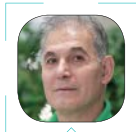
کیکا ووس بازیاری جام جم

بهترین‌های امسال مراسم گلدن گلوب (کره طلایی) اعلام شد و هیجان‌های مربوط به فصل جوایز سینمایی در هالیوود را با رونق تازه‌ای همراه کرد. همان‌طور که برخی رسانه‌ها و تحلیلگران پیش‌بینی می‌کردند دو فیلم «داستان وست ساید» استیون اسپیلبرگ و «قدرت سگ» جین کمپین، برندگان اصلی این دور از رقابت‌های گلدن گلوب شدند. اهل فن از مراسم گلدن گلوب به‌عنوان مهم‌ترین رویداد سینمایی قبل از مراسم اسکار اسم می‌برند و عقیده دارند در این مراسم بسیاری از جوایزی که فیلم‌ها و آدم‌ها در مراسم گلدن گلوب دریافت کرده‌اند، دوباره تکرار می‌شود. تاریخ هر دو مراسم اسکار و گلدن گلوب حکایت از درستی این اظهارنظر و ادعا می‌کند. بسیاری از کسانی که در مراسم گلدن گلوب دست پر به خانه می‌روند، در مراسم اسکار هم همان موفقیت‌ها را تکرار می‌کنند. البته تفاوت عمده و اصلی گلدن گلوب با اسکار در این است که جوایز اصلی بهترین فیلم و بازیگران را در دو رشته درام و کمدی می‌وزیکال اهدا می‌کند. طبق یک سنت قدیمی، اعضای آکادمی اسکار نگاه چندان مثبتی به آثار کمدی و موزیکال ندارند و زمان اهدای جوایز، فیلم‌ها و افراد این ژانرهای سینمایی سرشان بدون کلاه می‌ماند. مراسم گلدن گلوب را اتحادیه روزنامه‌نگاران خارجی مقیم هالیوود برگزار می‌کند و جوایز خودش را هر سال در اول مارس ۲۰۲۱ طی مراسمی رسمی و باشکوه اعلام می‌کند.