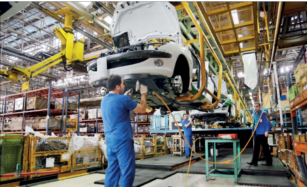
کیبیت محصولات یکی از چالش‌های اصلی ایران خودرو بوده است.

رئیس کل بانک مرکزی تاکید کرد: بانک‌ها موظفند در چارچوب مقررات موجود کشور، وام‌های خرد را طبق روال گذشته پرداخت کنند و به هیچ عنوان نباید پرداخت وام‌ها را با روش‌های گذشته و کنونی متوقف کنند. علی صالح‌آبادی تصریح کرد: بانک مرکزی درتلاش است مقررات موجود را با هدف تسهیل