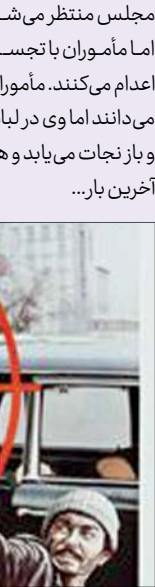
بازیگران: مجید رجبعلی.