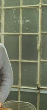
فیلم «پنجاه‌وسه نفر» با روی آنتن شبکه دوی سیما