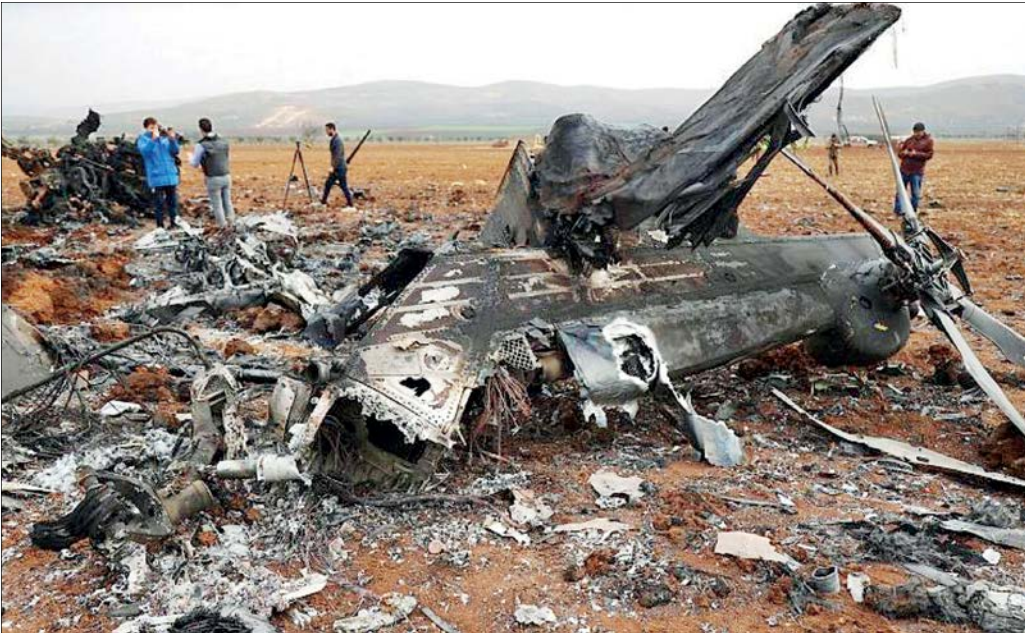
بالگرد آمریکایی هلاک در عملیات اخیر در ساحه وسیع منهدم شد

بهرتر است مقامات کاخ سفید به سولات دیگری نیز در این خصوص پاسخ دهند ازجمله این که نقش تروریست‌های «سنتکام» در فراری دادن بسیاری از نیروهای داعش درصحنه نبرد با ارتش عراق و سوریه و هدایت آنها به سوی مکان‌های نامعلوم و بیابانی در مناطق مرزی و صعب‌العبور این دو کشور چه بوده‌است؟ همچنین بهتر است بایدن، بلینکن، سالیوان و دیگر مقاماتی که اکنون در کاخ سفید به کار مشغول هستند، نقش دقیق خود را در جریان ایجاد داعش در سال ۲۰۱۳ تشریح کنند. فراموش نکنیم در معادلات امنیتی جهان امروز (خصوصاً در منطقه غرب آسیا)، داعش نقش متغیر وابسته و آمریکا نقش متغیر مستقل را ایفا می‌کنند. به عبارت بهتر، حیات داعش امروز به حیات آمریکا و رژیم اشغالگر قدس و برخی کشورهای منطقه مانند عربستان سعودی و امارات متحده عربی گره خورده‌است. در چنین شرایطی ادعای مقامات آمریکایی مبنی بر مبارزه با تروریسم داعش، چیزی جز یک ادعای دروغین محسوب نمی‌شود.