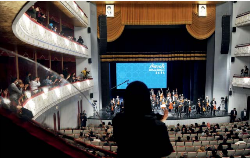
اجرای ارکستر سمفونیک تهران در جشنواره فجر