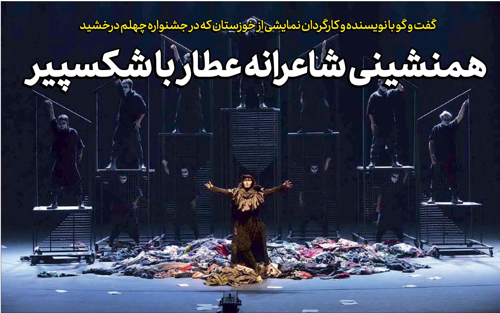
نمایش «نمایش امشب» ای بر قتل ژولیو سزار و چند مرغ از سیمرغ