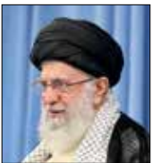
ایران در دوره جدید تحریم‌های غرب رایی‌اثر کرده واین سیاست قطعی و دائمی جمهوری اسلامی است

آیت‌ا... اعرافی افزود: برای فرآیند بودجه‌نویسی اقدامات مناسبی شده است اما در عین حال معتقدیم کار اصلی باید روی اصلاح ساختار بودجه از سوی دولت و مجلس باشد.