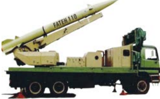
تصویری از موشک فاتح ۱۱۰