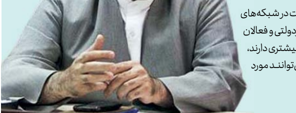
ای ممکن است در شبکه‌های مردمی و غیردولتی و فعالان که تأثیرگذاری بیشتری دارند، د و بیشتر می‌توانند مورد

ت به مفاهیم دینی داشت و حساسیتی به مخاطب امروز که همه ارتباطش با مسائل عمومی از پیام‌های رسانه‌ای بسیار تأثیر ی اهمیت زیادی قائل است و این نماده‌ا جدیدنظر در شیوه بازنمایی مضامین دینی در آن باره از ظرفیت‌های فضای