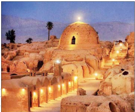
اقامتگاه بومگردی کریت