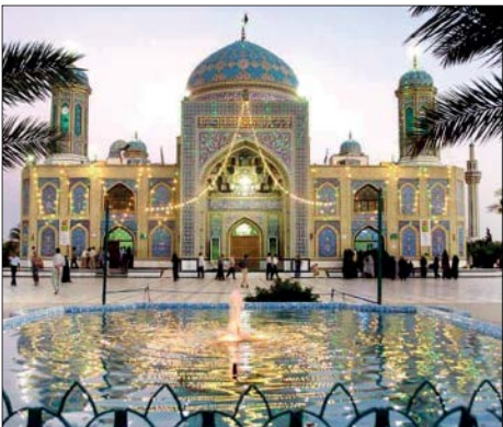
امامزاده حسین بن موسی الکاظم (ع)