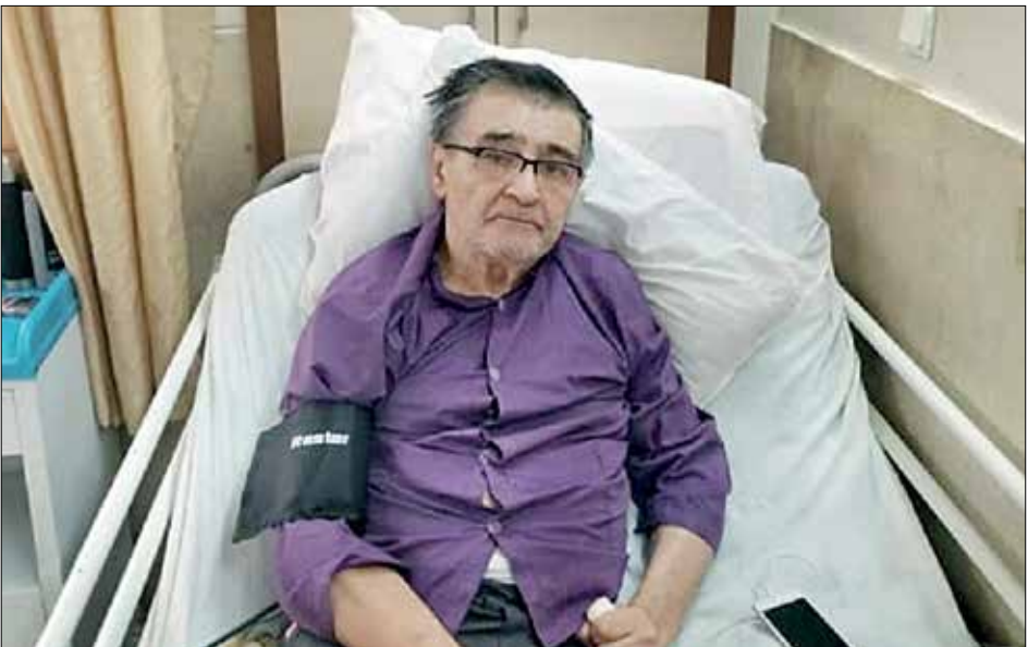
بعد از انتشار ویدئویی از رویکرد تعدادی هنرمندان از حمایت‌کنندگان