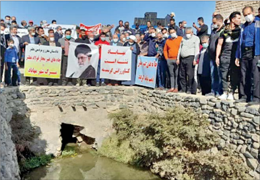
اجتماع دانش‌آموزان مهابادی در واکنش به خشکشدن قنات شهر توسط کارخانه فولاد

همدان جاذبه طبیعی و تاریخی کم ندارد و اگر مسافر این استان زیبا شدید، می‌توانید سراغ یک یک آنها را از راهنمایان گردشگری منطقه بگیرید. اخیرا اما شش اثر تاریخی این استان به ثبت ملی رسیده و حفاظت از آنها طبق قانون بر همگان واجب شده است، اینها را آگفتیم که بدانید از این پس در سفر همدان می‌توانید از این شش