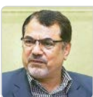
تحلیل‌گر مسائل غرب آسیا