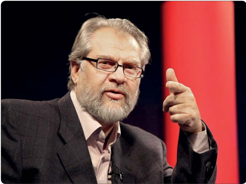
زندنیاد نادر طالب‌زاده مجری برنامه عصر ادب شبکه افق ایود

صداوسیما در امور فرهنگی هم در صفحه شخصی‌اش از بستری شدن نادر طالب‌زاده در بیمارستان خبر داد. در بخشی از این نوشته آمده بود: «استاد نادر طالب‌زاده، سردار سرفراز جبهه فرهنگی انقلاب اسلامی لحظات بسیار سختی را در اتاق مراقبت‌های ویژه می‌گذراند.» مسعود ده نمکی، کارگردان سینما با انتشار عکسی از نادر طالب‌زاده، مستندساز، تهیه‌کننده و مجری تلویزیون در صفحه اینستاگرامش از حال نامساعد او خبر داد و نوشت: «برای شفای عاجل حاج‌نادر عزیزمان که لحظات سختی را در اتاق مراقبت‌های ویژه می‌گذراند