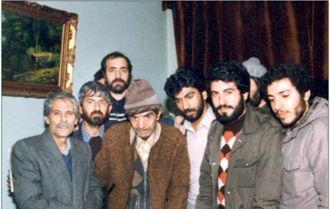
اوستا افشارمست چپا اثر دکتر استادشهپور، موزه اسرائیلی وایمن چپ