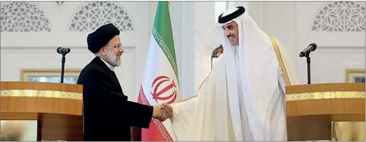
امیر قطر به زودی به تهران سفر می‌کند

جمهوری اسلامی ایران داشته است، البته این روابط کاملاً دوطرفه بوده و زمانی که قطر مورد تحریم کشورهای عربی قرار گرفت، ایران بود که به این کشور کمک کرد. این دو کشور از طریق یک راه دریایی به طول ۲۶۸ کیلومتر به هم پیوند می‌خورند اما در این ارتباط یک اشکال وجود دارد. گرچه قطر مثل بیشتر همسایه‌های ایران از اشتراکات زیاد تاریخی و فرهنگی برخوردار است ولی