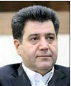
حسین سالارپور نماینده شورای عالی بورس