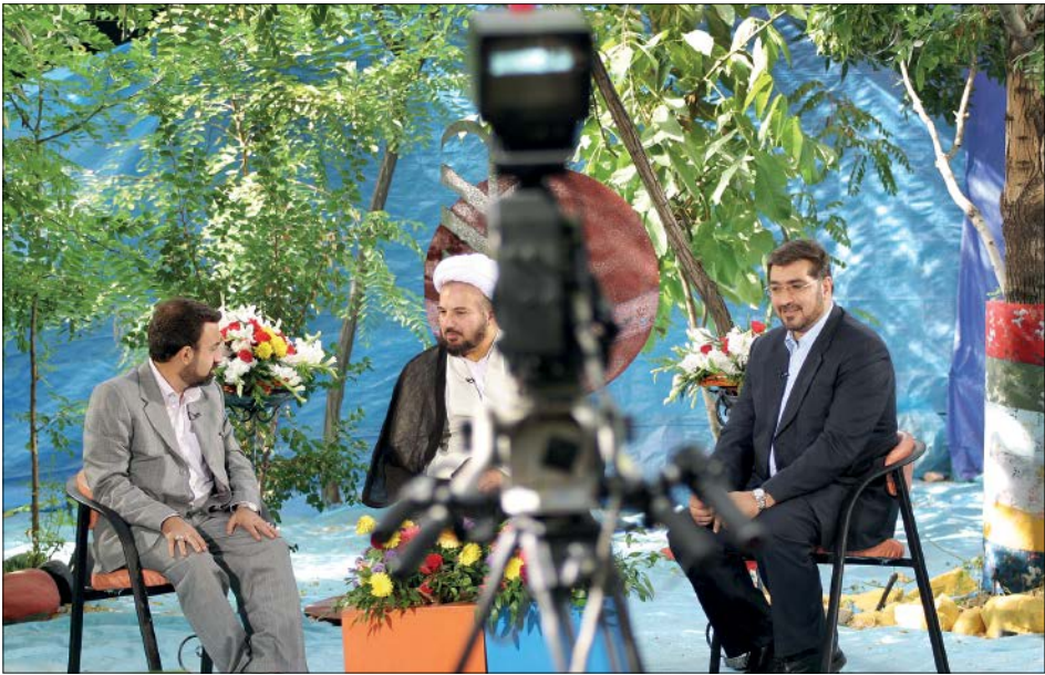
صبح‌پخیر ایران یکی از برنامه‌های صبحگاهی شبکه یک است