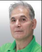
کیکا نوسری گروه فرهنگ و هنر

«تام کروز» ۳۰ سال قبل و بعد از ساخت فیلم «تاپ‌گان» اعلام کرده بود، ادامه ساخت این فیلم، ستایش جنگ افروزی است اما حالا قسم خورده که ارائه بهترین دنباله ممکن برای تاب‌گان را مسؤولیت خود می‌داند.کروزآن زمان در وسایط گیزمودو گفت: «بعضی افراد حس می‌کنند تاپ‌گان فیلمی جناح‌راستی است برای تبلیغ نیروی دریایی. بسیاری از بچه‌ها هم دوستش داشتند اما می‌خواهم بچه‌ها بدانند، جنگ این نیست و تاپ‌گان فقط مثل یک شهر بازی است. فیلمی تفریحی که مخصوص بالایا ۱۳ ساله‌هاست و قرار نیست واقعیت را به تصویر بکشد. برای همین است که تاپ‌گان ۲ و ۳ و ۴ را نساختم. این دیگر می‌شد بی‌مسؤولیتی.»اما او حالا در تبلیغات فیلم گفته است: تا وقتی که داستانی که ارزش تعریف کردن داشته‌باشد و فناوری پیشرفته‌ای که کمک‌مان کند بیشتر در عمق تجربه خلبان‌های جنگنده فرو برویم را نداشتیم، آماده نبودم دنباله‌ای برایش بسازم. با نیروی دریایی و مدرسه تاپ‌گان همکاری کردم تا به راهی برای فیلمبرداری عملی دست پیدا کنیم. تاپ‌گان: ماوریک، ۲۷ می‌در سینماها اکران خواهد شد. / مهر