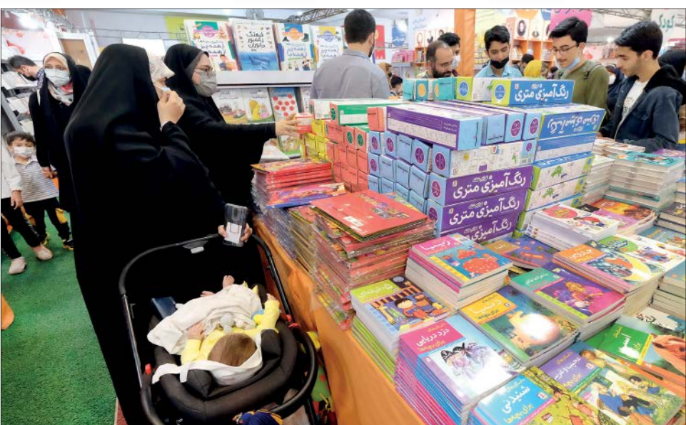
گزارش مهرشاد جام‌جم