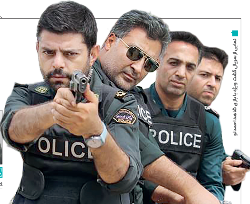
نمایی از سریال گشت ویژه با بازی شاهد احمدلو