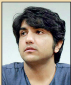
کریم لک‌زاده فیلمنامه‌نویس و کارگردان

این‌که چطور یک پلیس در آثار نمایشی قهرمان می‌شود، بستگی به این دارد که رسانه و همچنین خود پلیس چه می‌خواهد نشان دهد. البته بخشی از آن هم مربوط به ویژگی‌های است که برای مردم جالب است و اصطلاحاً یک شخصیت سینمایی را خلق می‌کند. به نظر من کاراکتر جالب، آنی است که اشتباه کند سپس بکوشد اشتباه‌اش را جبران کند. به میزان قابل قبولی هوش دارد اما مثل هر آدم دیگری خصلت‌های منفی هم دارد. این وجوه، شخصیت