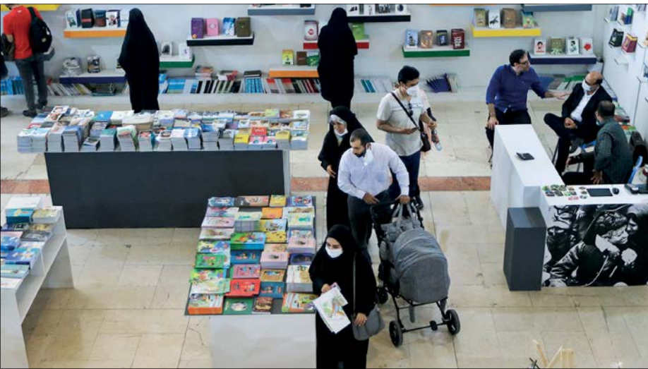
خلوتی نمایشگاه در روز آخر، بسیار رهشود بود اینجا

سی و سومین دوره از نمایشگاه بین‌المللی کتاب هم با تمام حواشی پیش و پس از آغازش، به ایستگاه پایانی خود رسید و روز گذشته، بخش حضوری این نمایشگاه به کار خود پایان داد. روز پایانی نمایشگاه اما با استقبال کمی از سوی مردم برخوردار بود و شبیه روزهای ابتدایی، راه‌روها خالی بودند. با این‌که سخنگوی نمایشگاه کتاب در گفت‌وگو با جام‌جم به رقم بالای خرید مردم اشاره کرد اما ناشران همچنان از استقبال کم گلّه‌مندند.