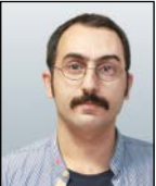
علی رستگار گروه فرهنگ و هنر

«زبل خان اینجا، زبل خان اونجا، زبل خان همه‌جا»، شعار شکارچی ناموفق در یک کارتون لهستانی بود اما سال‌ها بعد مهران رجبی به زبل خان موقی تبدیل شد که در همه کانال‌های تلویزیونی حضور داشت و حتی به قول مزاحی در کانال کولر هم می‌شد این بازیگر دوست‌داشتنی را به تماشا نشست! البته همچنان رجبی به حضور همواره‌اش در کارهای سینما، تلویزیون و شبکه نمایش خانگی ادامه می‌دهد. این بار اما دیگر تنها نیست و حتی عرصه این حضورهای پرتکرار را به چهره‌های دیگری واگذار کرده‌است. در این دو سه سال به ویژه این ماه‌ها، بعضی از بازیگران به قدری حضور ملموس و پررنگی دارند که انگار همه‌جا هستند. البته چشم ما شور نیست و خدا این حضورهای هنرمندانه را بیشتر و بیشتر کند اما وقتی نسبت این حضورها را با جمعیت بازیگران سینمای ایران مقایسه می‌کنیم، به یک انحصارچه بسا ناخواسته و دایره محدود می‌رسیم و این تکرار مکررات بیشتر به چشم می‌آید. فارغ از حضورهای تلویزیونی و سینمایی، تجمع این چهره‌های تکراری را بیشتر در پلتفرم‌ها و مجموعه‌ها و سریال‌ها و برنامه‌های شبکه نمایش خانگی می‌بینیم، درحالی‌که قرار بود و هست از ظرفیت این رسانه نمایشی به درستی استفاده شود و انبوه چهره‌ها و بازیگرانی که به ویژه در این سال‌های کرونایی خانه‌نشین شدند، بیشتر بهره ببرند و فرصت کار و اشتغال بر پایه یک عدالت‌محوری برای همه بازیگران فراهم باشد. در عمل اما می‌بینیم