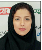
عسل اخوان پورانی گروه دانش و سلامت

استفاده می‌کنند. به نظر می‌رسد انعطاف‌پذیری بالاتر این نوع دارایی، مزایا و آزادی‌های بیشتری که نسبت به ارزش‌های رایج در تراکنش‌ها دارند، احتمالاً به‌زودی نقش مهمی در آینده کسب‌وکارها به‌ویژه در زیست‌بوم فناوری و فناوری خواهد داشت. این موضوع به‌ویژه در شرایط کنونی کشور ما که تحریم‌ها، مشکلات عمده‌ای را برای تبادلات مالی بین‌المللی کسب‌وکارها به همراه داشته است، می‌تواند مزایای زیادی به همراه داشته باشد. به همین علت به نظر می‌رسد در کنار اهمیت ایجاد بسترهای مناسب و قانونمند برای بهره‌گیری از این ظرفیت جدید دنیای فناوری در کشور، وقت آن رسیده است که صاحبان کسب‌وکار - به‌ویژه کسب‌وکارهای نوپا - نگاه جدی‌تر به کارکرد رمزارزها در توسعه کسب‌وکارشان داشته باشند.