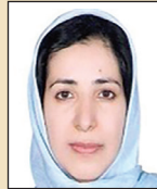
مترجم: نادیا زکالوند گروه دانش و سلامت

در بررسی روی کارمندان ایالات متحده، قبل و بعد از شروع عالم‌گیری کرونا، ۴۳ درصد کارکنان گرفتار نوعی فرسودگی شغلی شده بودند که این میزان در حال حاضر به نیمی از تمام کارکنان رسیده و البته باید گفت عالم‌گیری کووید-۱۹ وضعیت را بدتر کرده است. اما چرا؟ با توجه به این‌که هر کاری می‌کنند تا ما مزایای سختکوشی را باور کنیم، چرا دچار فرسودگی شغلی می‌شویم؟