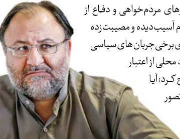
همین چرخه فاسد خواهنددید.

«ای‌کاش فعالیت‌های مدیریتی آنها به‌گونه‌ای بود که مردم از نتیجه اقدامات آنها احساس امنیت و آرامش می‌کردند، نه این‌که همین افراد در زمان مسوولیت‌شان برای مردم مصیبت بسازند و آن‌وقت بعد از وقوع یک حادثه تلخ، بخواهند از مصیبت مردم پلکانی برای بالا رفتن مجدد از نردبان قدرت بسازند.» این استاد علوم سیاسی دانشگاه در عین حال خاطرشان کرد: «بوجود تکاپوهای سیاسی و رسانه‌ای این جریان‌های سیاسی، مردم چندان اعتنایی به ادعا‌های مردم‌خواهی آنها ندارند و در دوره‌های گذشته شاید برخی تلاش‌ها در حوزه‌های مجازی و سیاسی روی افکار عمومی تأثیر می‌گذاشت اما اکنون دوره این تأثیرپذیری‌ها گذشته‌است. کوشکی اضافه کرد: این افراد تاکنون در این چرخه فاسد گذران امور کرده‌اند و هرچند وقت یک‌بار به قدرت رسیده‌اند، ولی طبیعتا این چرخه‌تاهمیشه نمی‌تواند ادامه‌پیدا کند، متأسفانه این جریان‌ها و گروه‌ها پیشفرض خود را بر این مبنا قرار داده‌اند که جامعه درک کافی و حافظه تاریخی ندارد و فقط احساسی رفتار می‌کند. این پیشفرض غلط‌البنیه به‌تدریج، به‌صورت برعکس عمل می‌کند، یعنی این‌که سطح آگاهی، توجه و حافظه تاریخی جامعه در حال افزایش است و آن‌وقت همین افراد و گروه‌هایی که با سوءمدیریت خود برای مردم مصیبت ساخته‌اند و می‌خواهند از این مصائب برای بالا رفتن از نردبان قدرت استفاده کنند، بدون تردید بیشترین آسیب را در همین چرخه فاسد خواهنددید.