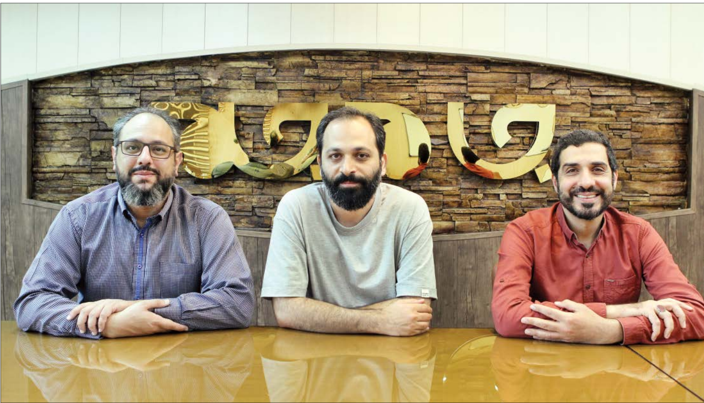
مهندسین - جام جم