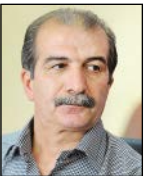
جبارآدین منتقد مدرس