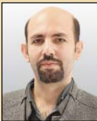
دبیر گروه سیاسی

رئیس‌جمهور آمریکا در جریان نشست جده درباره لزوم مقابله با تروریسم در منطقه صحبت کرده و مدعی شده که آمریکا به همکاری