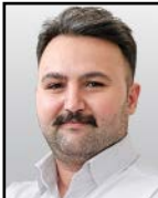
روح... قیطاسی گروه اقتصاد

قیمت مسکن همچنان بدون توجه به بسته های پیشنهادی دولت به روند صعودی خود ادامه می دهد و تامین سرپناه به یکی از دغدغه های جدی برای خانواده های ایرانی تبدیل شده است. طی دهه های اخیر قیمت مسکن با سرعت کمتری نسبت به تورم در حال افزایش بود و این شیب افزایشی از سال ۹۷ تشدید شده و بنا به داده های مرکز آمار، میانگین قیمت هر مترمربع از سال ۹۷ تا ۱۴۰۰ سه برابر افزایش یافته اما سرانه درآمد به این سرعت رشد نکرده. نتیجه این معادله نامتوازن فشار مضاعف بر جیب مستاجران و کاهش سطح رفاه عمومی است. این افزایش سه برابری سهم اجاره بها باعث کوچک شدن سفره و کاهش سهم سایر هزینه های خانوار شده. سهم اجاره بها در آمارهای رسمی حدود ۶۰ درصد هزینه های خانوار عنوان شده و رستم قاسمی، وزیر راه و شهرسازی این رقم را ۷۰ درصد می داند اما این آمار در برخی از مناطق به صد درصد رسیده است به این معنی که حقوق یک نفر از اعضای خانواده صرف پرداخت اجاره بها می شود.